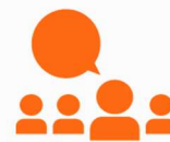
Weiterbildung & Training