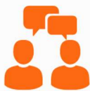
Coaching & Supervision

Personalverantwortliche und Führungskräfte entwickeln mit unserer Unterstützung eine gesunde Unternehmenskultur, die Potenziale und Verantwortungsbereitschaft würdigt und angemessen ausschöpft!